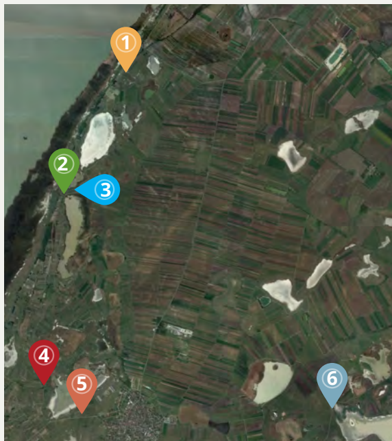
Wehr 1: Scheibenlacke